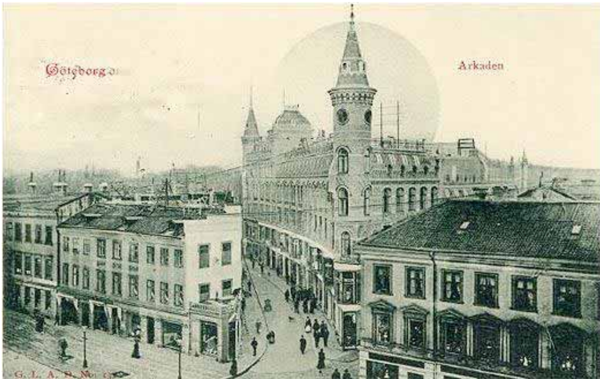
Den ståtliga Arkaden vid Göteborgs enda privata gata i centrum innan den revs

anrik och hade hunnit etablera aktningvärda traditioner. Dessa kördes helt enkelt sonika över och ihjäl av bulldozerpolitiken för främjandet av likriktning, nivellering och fyrkantig betongarkitektur.