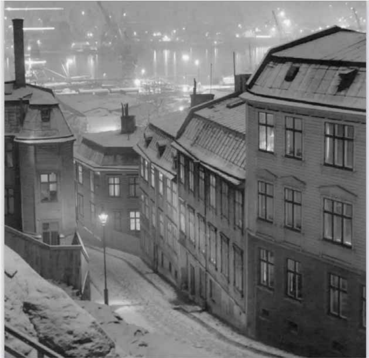
Gamla Klamparegatan före rivningarna