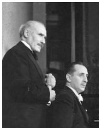
Arturo Toscanini med sin svärson Vladimir Horowitz

Så hade vi också tidens problem. Den seriösa musiken slogs ut av populärmusiken. Genom grammofon och radio blev billig vulgär musik var mans egendom och spelades och nöttes överallt. På 1800-talet var det Verdis operamelodier som spelades överallt på positiv och sjöngs i gränderna av vilka tiggare som helst, men genom automatiseringen i grammofon och radio blev musiken kommersiell på allvar och slogs mynt av i vulgäraste tänkbara form genom jazz och schlagers. Den höga, idealiska musiken ersattes och överröstades av konsumtionsmusik, som dränkte renheten och förstörde finkänsligheten och körde över all möjlig nyansering, som diskvalificerades till förmån för volymen, motoriken och automatiken. All idealism försvann och omöjliggjordes, och vad är musik utan idealism? Bara meningslöst nonsens. Den dåliga billiga kommersiella musiken har tagit över, dränker och kränker den riktiga musiken till osynlig oigenkännlighet, som får ständigt allt svårare att göra sig hörd. Den levande musiken är överkörd av automatiseringen. Också det är en fullgod anledning till att söka sig bort från offentligheten och koncentrera sig på enbart den konstnärliga kvaliteten. Risker är att meningen med musiken skall gå förlorad.