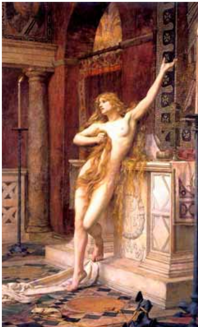
Hypatia vädjande vid altaret i kyrkan Caesarion omedelbart före sin massaker i mars år 415, enligt målaren Charles William Mitchell 1885.

Vi har därför aldrig blivit av med henne. Hon väntar fortfarande på sin utredning. Jag har visst skrivit om henne förut, för trettio år se'n eller så. Hon var just en sådan unik kvinna som man aldrig tröttnar på att återvända till, och som alltid kommer tillbaka.