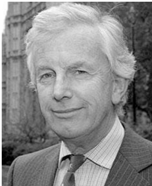
Bruce Lockhart, 1887-1970

“Jag har aldrig stuckit under stol med att jag är alkoholist, lika litet som Churchill gjort det. Han till och med ordinerades obegränsade mängder av whisky av sina läkare under 20-talet i Amerika, vilken preskription han alltid tagit på fullaste allvar. Man blir alkoholist om man kommer till Ryssland, särskilt i officiella ärenden, det vet alla som kommer dit, att det är omöjligt att undvika att dricka vodka som vatten, men jag har aldrig klagat, då jag aldrig mått illa av det. Det har inte Churchill heller.”