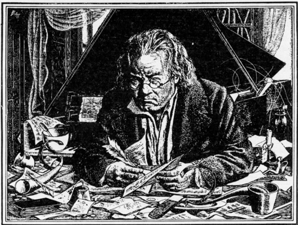
Beethoven under de sista åren.

I stället fick han göra en ny avslutningssats till opus 130, som blev hans sista avslutande komposition, som är helt förunderlig genom sin ungdomliga friskhet och galanta vigör, som om egentligen ingenting hänt mellan hans första sex stråkkvartetters mästerverk och den sista i fullkomlig dövhet 30 år senare.