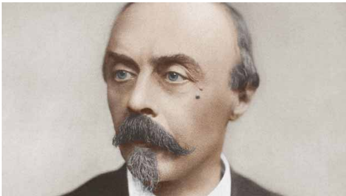
Hans von Bülow, 1830-1894

respekterade mina horn i pannan, men man respekterade inte den stackars bedragne kungen, vars ideal hänsynslöst släckts av Wagners vänsterprassel med den skandalisering av kungen, som gjort allt för honom, som det innebar. Och Cosima Liszt skämdes aldrig men står ännu upprätt som Wagners främsta förkämpe och håller på att bli den värsta skräcködlan i Tyskland. Det sägs redan om henne, att det fanns bara en mera vedervärdig person i Tyskland än Wagner, och det var Cosima Wagner. Som min hustru var hon åtminstone respektabel.”